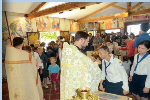
LITURGIE DU DIMANCHE AU CAMP 2015