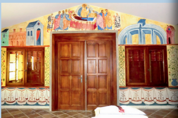
FRESQUE DE LA DORMITION

et pose de volets sur les fenêtres latérales