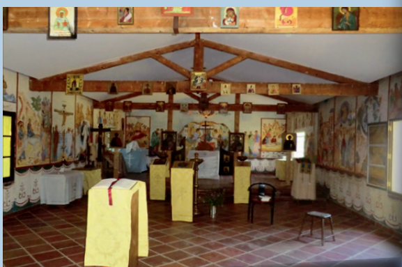
ISOLATION PHONIQUE DE LA TOITURE

L'aménagement de l'église du camp de l'ACER-MJO à La Servagère, est déjà bien avancé.