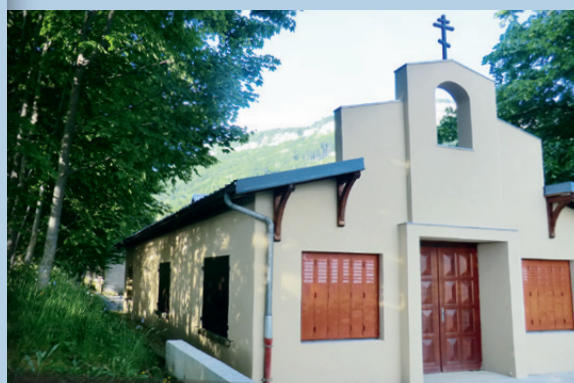
RAVALEMENT DU BÂTIMENT...

et pose de volets sur les fenêtres latérales